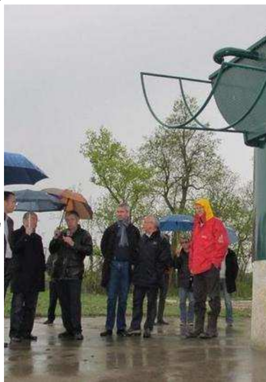
Les 21 puits de l'île aux Vaches où Tours puise une partie d montant total de 4,7 millions d'euros.

En Indre-et-Loire, le schéma directeur d'aménagement et de gestion des eaux impose une diminution de 20 % à l'horizon 2015 des prélèvements d'Amboise et de Tours. Ce schéma prévoit aussi de « mutualiser les ressources renouvelables que sont les nappes alluviales et les eaux de surface ». Des consignes que Chambray-lès-Tours va observer à la lettre grâce à la coopération avec Tours. « Nous puisons actuellement un million de m 3 par an, explique Christian Gatard, le maire de la commune. Comme nous allons acheter, au minimum, 250.000 m 3 d'eau chaque année à Tours, nous réduisons nos prélèvements dans la nappe fossile d'au moins 25 % ».